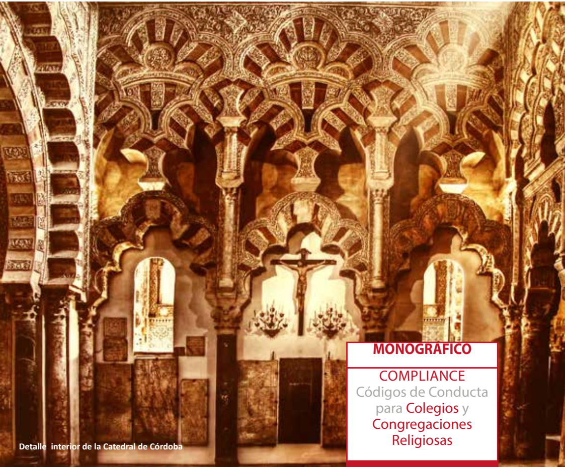
Detalle interior de la Catedral de Córdoba