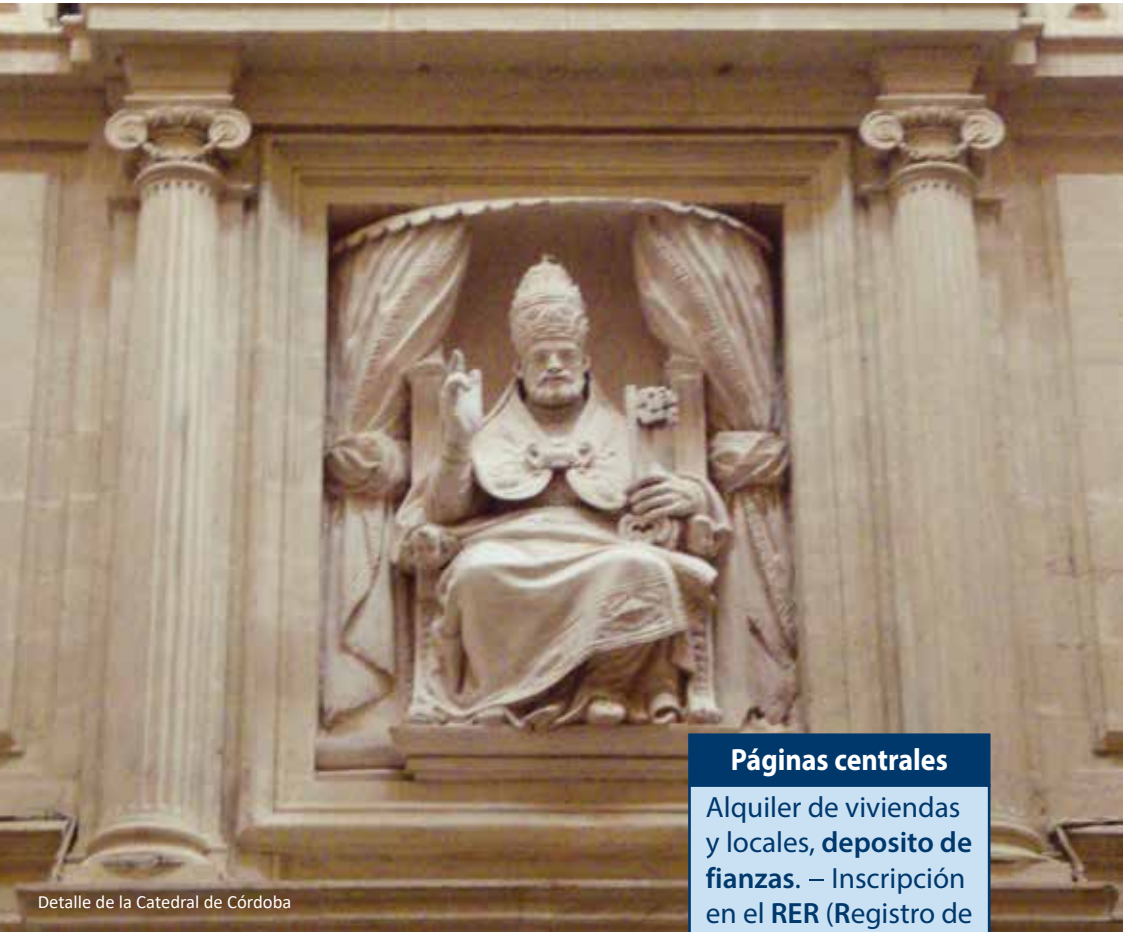
Detalle de la Catedral de Córdoba